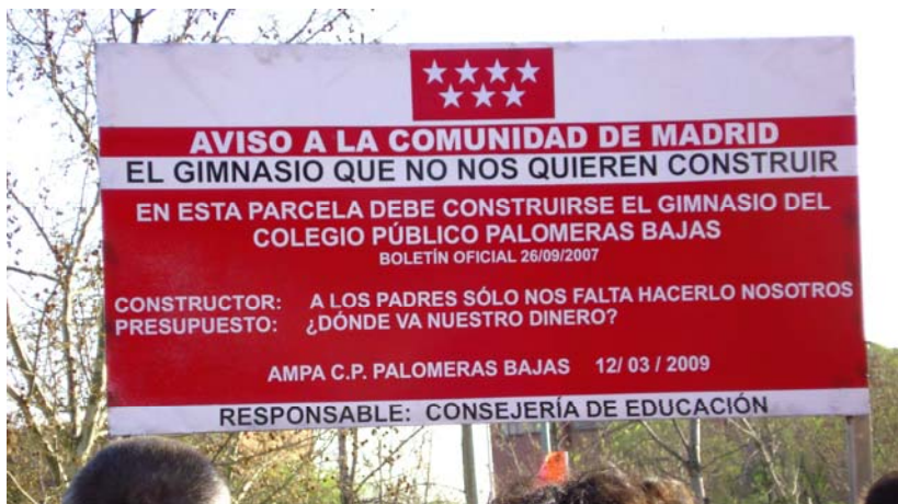
Cartel de "Inauguración de Obras" que se colocó en la concentración reivindicativa (12-03-2009).