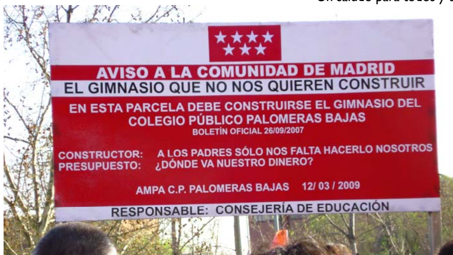
Cartel de "Inauguración de Obras" que se colocó en la concentración reivindicativa del gimnasio (12-03-2009).